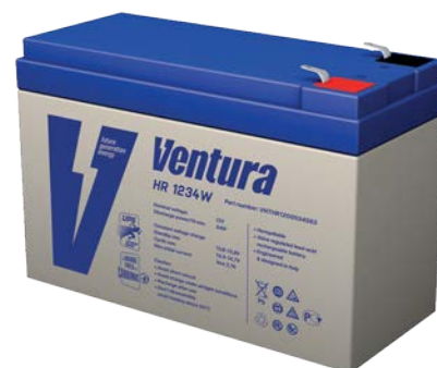
Габаритные размеры, мм

Примечание: приведены средние значения, полученные в течение трех циклов заряда/разряда Производитель оставляет за собой право вносить изменения в связи с проводящимися мероприятиями по оптимизации типов